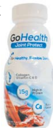
Питательный шоколадный шейк (The Protein Drinks, Великобритания)

ный коллаген, в первую очередь, остается в суставном хряще, где стимулирует выработку «внутреннего» коллагена в клетках хряща; таким образом удастся предотвратить износ суставов.