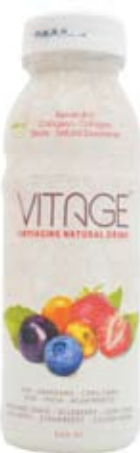
Натуральный напиток против старения (Grupo Exal SAC, Перу)

С помощью гидролизированного коллагена можно повысить содержание белка в напитке до желаемого уровня, так как даже при высокой концентрации он не влияет на консистенцию готового продукта.