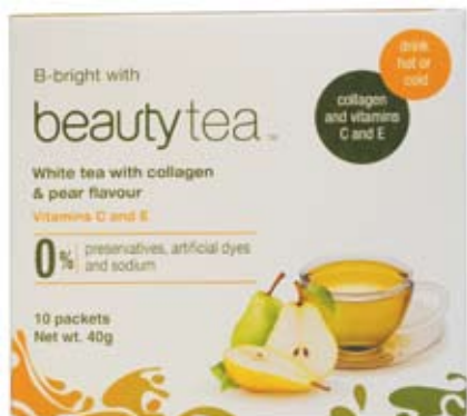
Beauty Tea, персиковый белый чай с коллагеном (Beauty'in Comércio de Bebidas, Бразилия)

Напитки этой категории позиционируются как оказывающие благотворное влияние на состояние кожи;