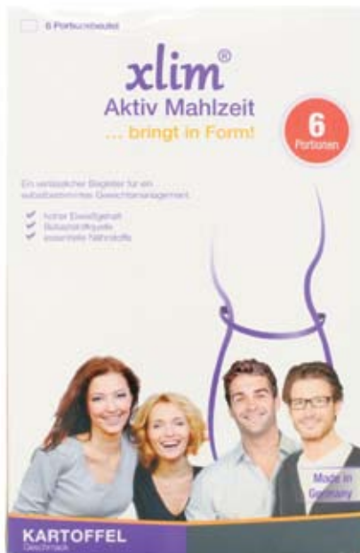
Сухая картофельная смесь — заменитель питания для контроля веса (Biomo-Vital, Германия)